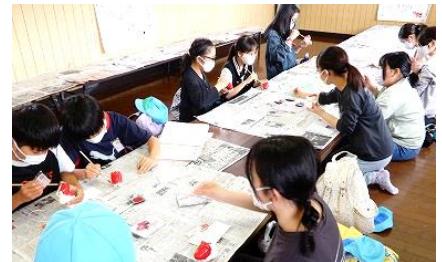
<赤べこ絵付け体験>