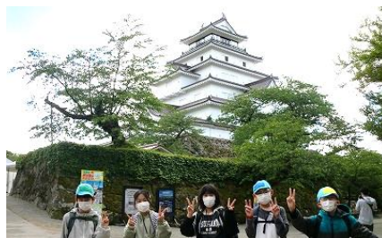
<鶴ヶ城での記念撮影>