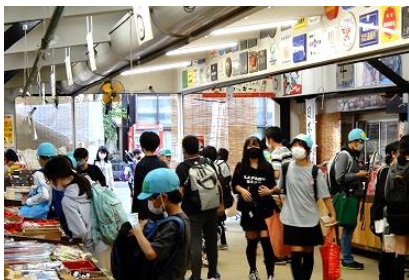
<飯盛山での買い物>

6年生が楽しみにしていた福島県会津若松市への修学旅行が6月9日(木)10日(金)に行われました。一日目のモータボート体験、自主研修は天気恵まれましたが、二日目は、雨が降って予定を変更することもありました。二日間、けがや大きく体調を崩す児童もなく、皆楽しい思い出ができたようです。これから、まとめの学習を行って参ります。